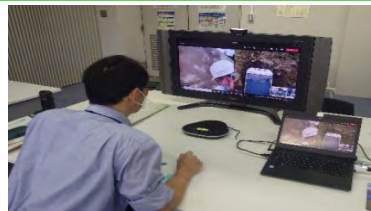
技術者が、カメラ映像を確認し、現場へ指示